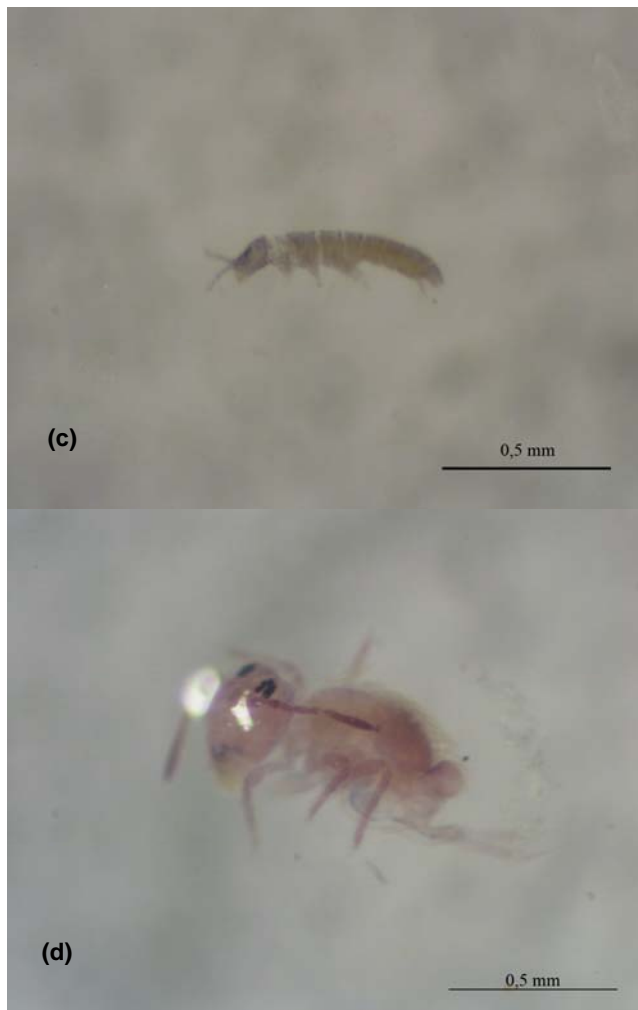
Gambar 2 (lanjutan). Collembola di lahan revegetasi tailing timah berumur antara 3 – 13 tahun di Pulau Bangka (c) Isotomidae, (d) Sminthuridae.

Perbedaan jumlah individu, jumlah jenis, dan frekuensi di semua lokasi penelitian kecuali pada umur nol tahun diduga disebabkan oleh suksesi di lahan revegetasi tailing timah (Hopkin, 1997), yang tidak terlepas dari prosedur standar revegetasi yang dilakukan, waktu pengambilan contoh yang terkait dengan musim (Hopkin, 1997), dan komposisi jenis kelompok Collembola yang hidup di permukaan tanah ( epiedaphic group ), dan kedekatan lokasi penelitian dari lahan tidak terganggu. Tanam revegetasi dan jenis tumbuhan yang menginvasi selama suksesi berperan dalam perbaikan mikroklimat yakni kelembaban relatif udara dan kelembaban tanah, terutama di sekitar lubang tanam, dan siklus hara yang antara lain ditopang oleh dekomposisi serasah dari tanaman revegetasi dan dari tumbuhan yang menginvasi. Kelembaban relatif disebut sebagai salah satu faktor penting yang menentukan aktivitas dan penyebaran Collembola . Perbaikan mikroklimat diduga berperan dalam peningkatan keragaman dan aktivitas fauna tanah.